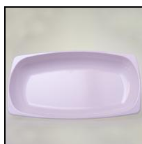
Snackschale 18/23cm Box à 100 Stk.