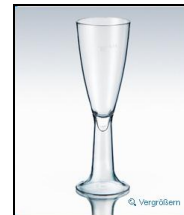
Cupli PC 1dl Box à 100 Stk.