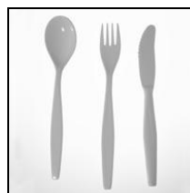
Messer, Gabel, Löffel Box à je 100 Stk.