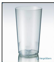
Design Cup PP „Reinach“ 3dl: Box à 350 Stk.