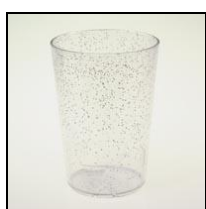
Design Cup PC 1dl „Glitzer“ Box à 300 Stk.