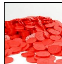
Pfand Chip Rack à 500 Stk.