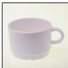
Kaffeetasse 2dl Box à 150 Stk.